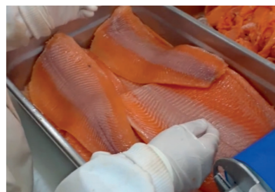
Truite fumée sortant de la peleuse V1258